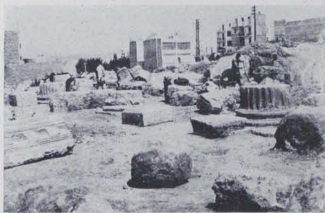
Fig. 154. — Ruïnes del macellum de Tarraco després de les excavacions (Serra i Vilaró)

En el darrer període, l'atzar ha fet descobrir un forum destinat a mercat, macellum . Cal sempre distingir en les grans ciutats romanes el forum lloc d'assemblees polítiques i dels tribunals, del forum destinat a mercat d'oli ( forum olitorium ), o de peix ( forum piscatorium ), o de vestits ( forum vestiarius ). En les ciutats antigues i petites hi havia un sol forum on es reunien les activitats polítiques i les mercantils; posteriorment l'òrgan urbanístic es divideix i s'especialitza.