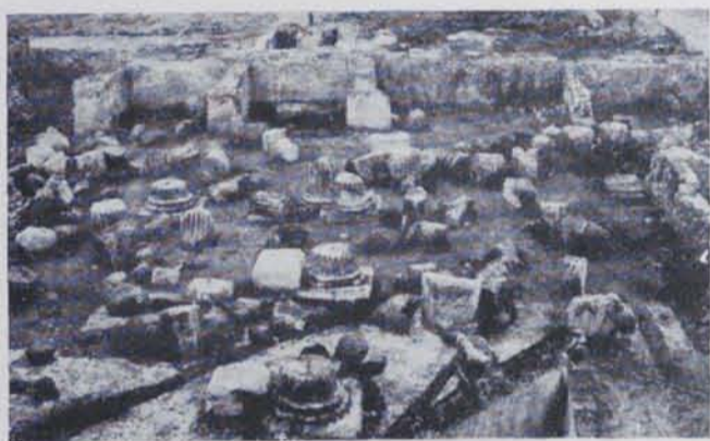
Fig. 156. — Ruïnes del macellum de Tarraco després de les excavacions (Serra i Vilaró)

En una de les cares hi ha un departament de diferent forma que les botigues, el destí del qual és possible que fos un temple com era el mercat de Pompeia. Diversos pedestals davant les columnes han estat trobats junt amb fragments d'estàtues. Manca descobrir la font central, corrent a tots els mercats descoberts, i la disposició dels taulells que tancaren les entrades de les diverses botigues com els que han estat trobats al macellum de Sertius, de Timgad i al de Casinius, de Djemila. Mossèn Serra i Vilaró té a punt una Memòria sobre les excavacions per ell dirigides, a càrrec de la Junta superior de Excavaciones y Antigüedades , on exposarà detalladament les seves recerques. — J. P. I C.