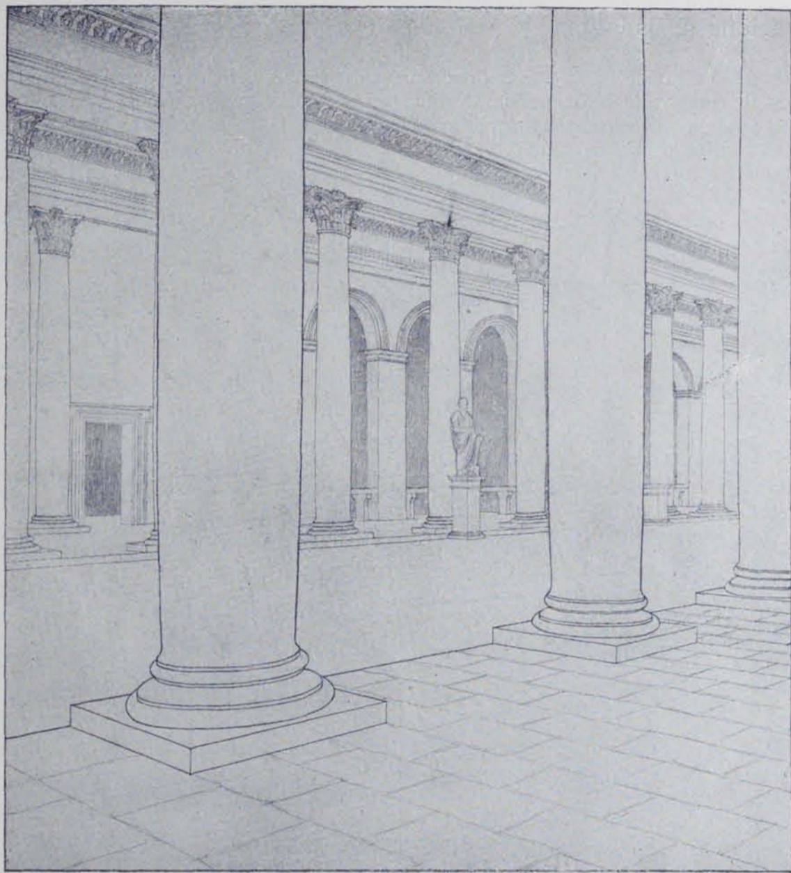
Fig. 155. — Restauració del macellum de Tarraco

En una de les cares hi ha un departament de diferent forma que les botigues, el destí del qual és possible que fos un temple com era el mercat de Pompeia. Diversos pedestals davant les columnes han estat trobats junt amb fragments d'estàtues. Manca descobrir la font central, corrent a tots els mercats descoberts, i la disposició dels taulells que tancaren les entrades de les diverses botigues com els que han estat trobats al macellum de Sertius, de Timgad i al de Casinius, de Djemila. Mossèn Serra i Vilaró té a punt una Memòria sobre les excavacions per ell dirigides, a càrrec de la Junta superior de Excavaciones y Antigüedades , on exposarà detalladament les seves recerques. — J. P. I C.